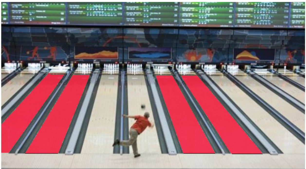
Double jump regel

Bowlers moeten te allen tijde de “one pair lane courtesy” respecteren. Zij mogen evenwel geen achtereenvolgende worpen uitvoeren zonder dat ze de bowlers op het paar aan de linker- en rechterzijde de kans hebben gegeven om een worp uit te voeren. Behalve als deze niet klaar zijn of hun beurt afstaan.